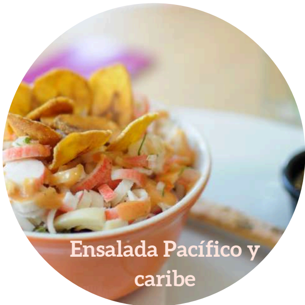
Ensalada Pacífico y caribe