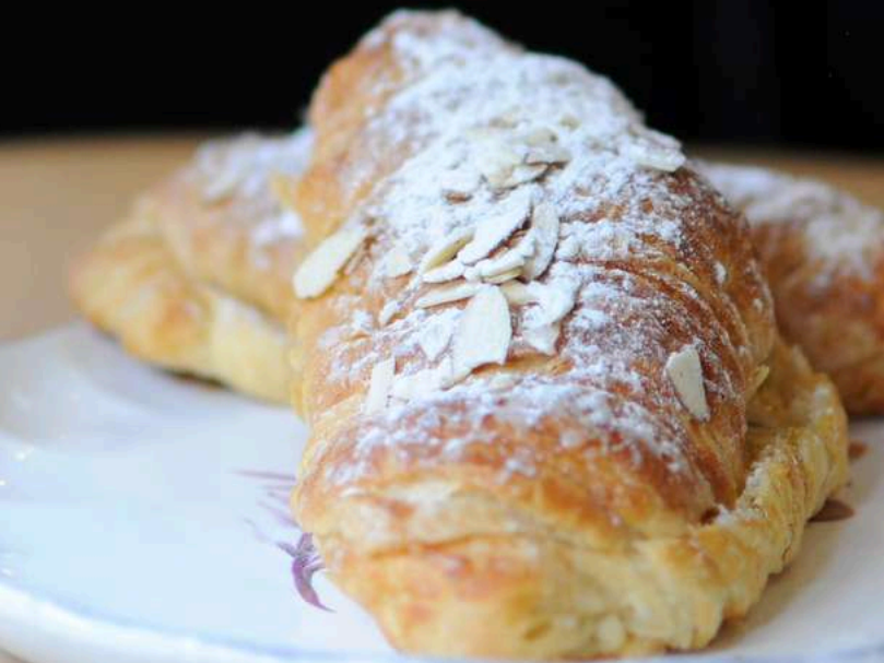
Croissant de almendras